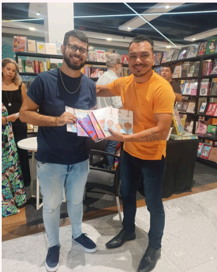
Feira Literária da Ananindeua - 2024