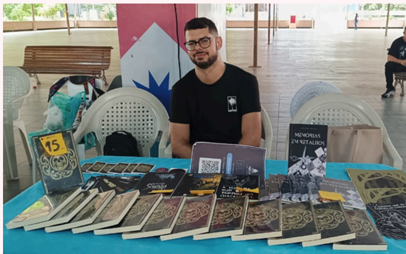
Feira do livro de Belém - 2022