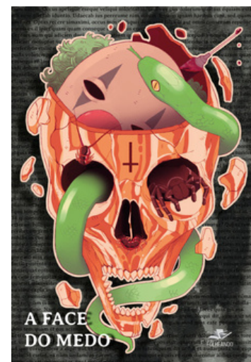
Premiação na Antologia A Face do Medo com o conto “A cathedral dos Mortos”