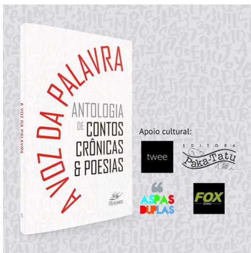
Premiação na Antologia A Voz da Palavra com o conto “O acalantar da Morte”