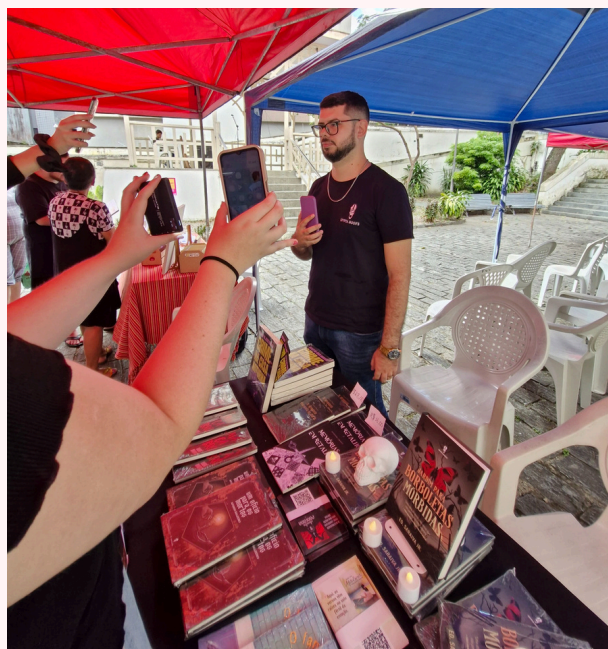
FLINT - 2025