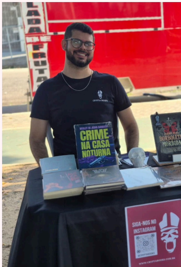
Feira de Ananindeua - 2026