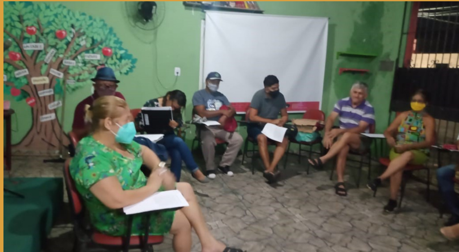
Escritores do município de Ananindeua - Pa, 2022.